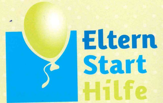
Illustration: © Justaa - Fotolia.com

Unterstützung und Beratung für Familien mit Säuglingen und Kleinkindern in Südtondern